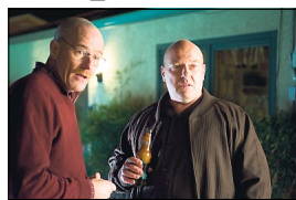
Walter White (tv) og hans svoger, narkobetjenten. Foto fra serien

Som i eksempelvis »The Sopranos« og »Dexter« er hovedpersonen altså forbrøder med så tilpas formildende