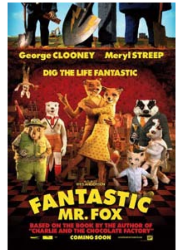
Fig. 1: Fantastic Mr. Fox , Wes Anderson, 2009.