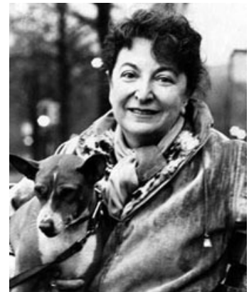
Fig. 2: Den amerikanske kritiker Pauline Kael døde i 2001, men hun nåede at se Wes Andersons anden spillefilm, Rushmore , ved en screening arrangeret af den unge instruktør og Kael-beundrer selv.