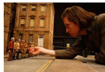
Fig. 3: Anderson på settet. Alt planlægges, diskuteres, analyseres og justeres, når Wes Anderson instruerer. Det gælder de traditionelle spillefilm, men det gælder i endnu højere grad, når der er tale om en dukkefilm som Fantastic Mr. Fox .

Man kunne tilføje at Andersons forkærlighed for deadpan -humor uden