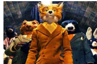
Fig. 5: Mr. Fox er den naturlige leder. Her fremstår han i al sin magt og væld, mens illusionen om den ubetingede sejr stadig lever...

Nu kommer Fantastic Mr. Fox måske til at lyde som en tung affære med alvorligt ondt i livet. Det er den langt fra. Den er gennemsyret af Andersons vanlige overskud og humor, ligesom den først og fremmest er en hyldest til såvel oprørstrang som tilpasningsevne. I forlængelse heraf har Wes Anderson udtalt, at han og medforfatter Noah Baumbach ikke bare har ladet sig inspirere af Roald Dahls børnebog af samme navn, men desuden har været påvirket af mennesket Roald Dahl i deres portrættering af Mr. Fox. En lang række genstande i Fox-familiens nyindrettede egetræ, er kopier af genstande fra Dahls arbejdsværelse. ligesom den efterårstone natur, der lægger scene til en række af filmens dramatiske begivenheder, er inspireret af området omkring Dahls hjem. (fig. 6)