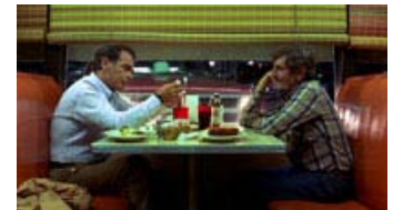
Fig. 4: Dineren – en af road moviegens genrespecifikke lokaliteter.

Det første spejlbillede dukker op, da Walter har samlet Travis op. Fra Travis' point of view fra bagsædet ses Walters ansigt snævert indrammet i bakspejlet. (fig. 6) Det er tydeligt, at Travis stadig har