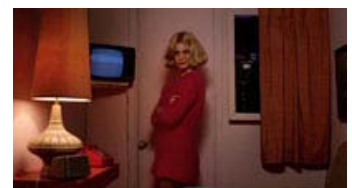
Fig. 2: Travis' perspektiv gennem spejlrefleksruden – her i rummet, der skal forestille et motelværelse.