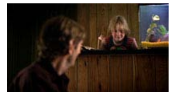
Fig. 12: Kameraets fokusskift forener far og søn.