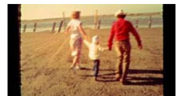
Fig. 11: Smalfilmen: Et spejl til fortiden.