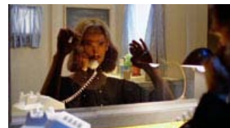
Fig. 16: To ansigter smelter sammen til ét.