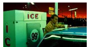
Fig. 3: Den purpurrøde himmel og det grønne skær ved tankstationen. Farverne er gennemgående i de fleste scener og understøtter splittelsen i Travis' sind.