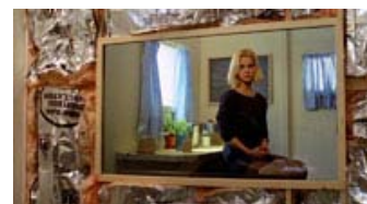
Fig. 15: Skærmen set fra Janes perspektiv. Bemærk den tydelige understregning af det ufærdige og kunstige rum, som Jane er fanget i.