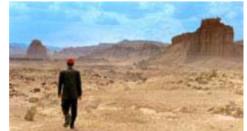
Fig. 1: Personlig deroute – Travis vandrer rundt i ørkenen.

Paris, Texas bevæger sig genremæssigt i grænselandet mellem road movien og melodramaet. Som titlen antyder, er tyskfødte Wenders' værk samtidig et udtryk for en sammensmeltning af europæiske og amerikanske filmtraditioner – en europæisk filmproduktion, der foregår i en hyperamerikansk kontekst. De fantastiske totalbilleder af ørkenlandskabet og den maleriske iscenesættelse af helt banale situationer, som Walter, der tanker benzin (fig. 3), kan ses som en tradition, der ligger i kølvandet på den postmoderne kunstfilm. Modsat den moderne Hollywood-produktion er de stilistiske virkemidler i Paris,