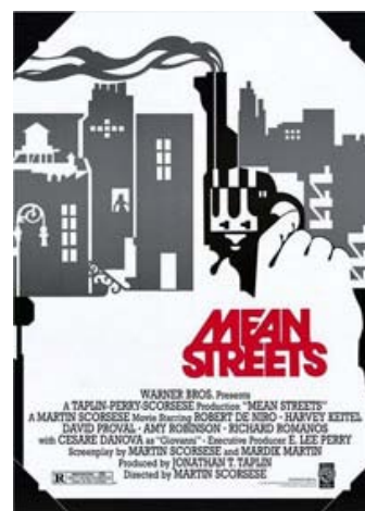
Figur 10: Mean Streets af Martin Scorsese er en af de film, der har fascineret Vinterberg mest.