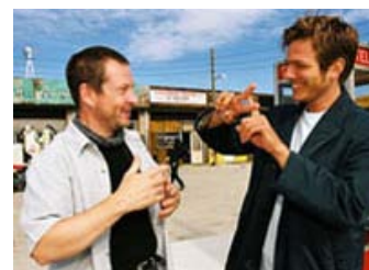
Figur 6: Vinterberg føler, at det der adskiller ham fra von Trier er, at hvor