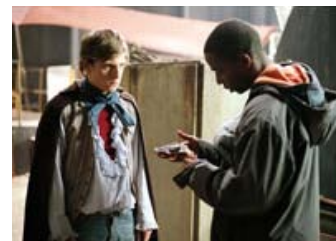
Figur 7: I det øjeblik hvor der opstår en jalousi historie mellem to mennesker og en pistol føler Vinterberg, at konstruktionen i von Triers manuskript tager overhånd, og det kan man ifølge Vinterberg mærke på Dear Wendy .

Vinterberg forsøge at opdage karakterernes eget liv, er von Trier afhængig af, at gøre sine karakterer og kameraer til skakbrikker, som han kan flytte rundt med alt efter behov.