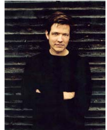
Figur 1: Thomas Vinterberg er aktuel med den barske Submarino , og i den forbindelse har han givet interview til 16:9.

Det er meget interessant. Det har flere sagt. For det første bliver jeg