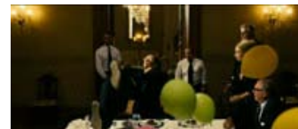
Figur 5: Denne scene fra En mand kommer hjem er et eksempel på den Fellini-inspirerede galskab, som Vinterberg gerne ville haft mere af i filmen.

Det var et lykketræf. Eller lykketræf er nok alligevel at negligere det for meget. Lidt geniale var vi alligevel. Hvis vi skal tale om form, så er forskellen på Lars von Trier og mig, at han rykker sine karakterer og kameraer rundt som skakbrikker og sidder oppefra og vender det hele på hovedet. Det gør han hver gang, og han er afhængig af at gøre det. Det er dét, der giver ham energi til at lave film og samtidig skaber energien omkring ham. Det er også det, der presser historierne. Han er formmæssigt avantgarde og afhængig af hele tiden at vende tingene på hovedet. Hvorimod jeg ser verden igennem øjnene på mine karakterer: naivt, forvirret, søgende, famlende, men dog med meget stor indlevelse og indimellem skaber det meget indholdsrige film (fig.