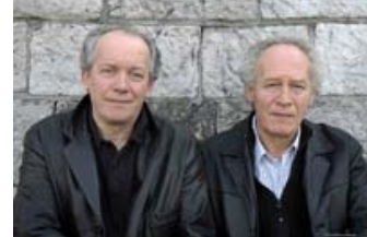
Figur 8 og 9: Vinterberg føler sig filmisk nærmere beslægtet instruktører som Ingmar Bergman og Dardenne-brødrene end for eksempel Lars von Trier eller Stanley Kubrick.