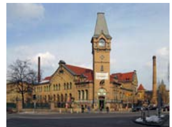
Fig. 9: 25.000 kvadratmeter kultur i det gamle Schultheiss bryggeri i hjertet af Prenzlauer Berg.