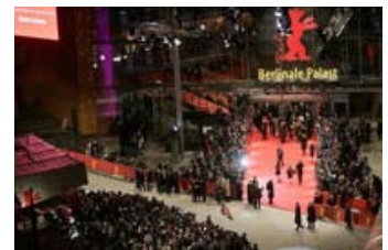
Fig. 2: Røde løbere og glamour. Leonardo Dicaprio er på vej!