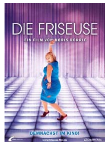
Fig. 10: Die Friseur er sjov på idéplanet. I praksis er der dog ikke meget at grine af.