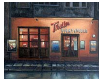
Fig. 5: Tilsiter Lichtspiele, det nærmeste, man kommer en østberlinsk biografoplevelse fra tiden før Murens fald.