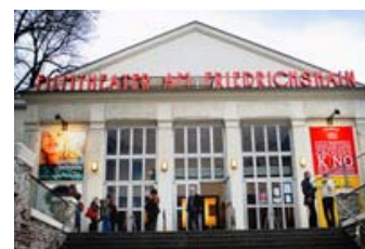
Fig. 7: Filmtheater am Friedrichshain, Berlins bedste biograf.