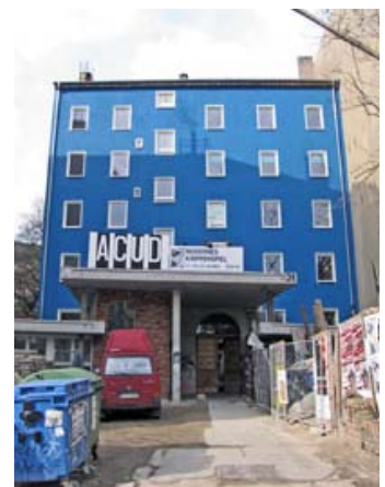
Fig. 3: Facaden er nydelig, men indenfor