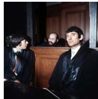
Fig. 4: Så gode venner var de vist. Horst Mahler, Hans-Christian Ströbele og Otto Schily i Die Anwälte .