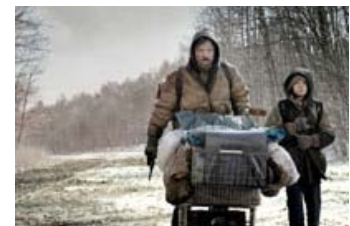
Fig. 2: Far og søn 'on the road' med kun de mest livsnødvendige ting i vognen.