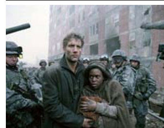
Fig. 9-10: I Children of Men er alle jordens kvinder blevet sterile, der er ikke født børn i 18 år, men pludselig sker miraklet. Et barn fødes, og kampen for at beskytte det og dermed redde menneskeracen – og den sidste rest af menneskelighed - starter. Som The Road er også Children of Men en visuel oplevelse, en handlekraftig mand er beskytteren, men tempoet og æstetikken er en ganske anden.