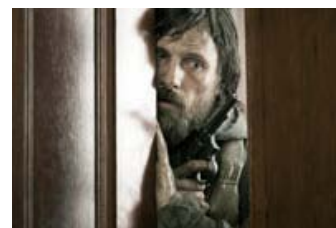
Fig. 11: Pistolen er en ting, der faktisk er nærværende i stort set hver eneste frame i The Road . Drengen instrueres ad flere omgange i, hvordan han skal bruge den til at skyde sig selv. Effektivt selvmord er essentiel børneopdragelse i verden efter katastrofen.