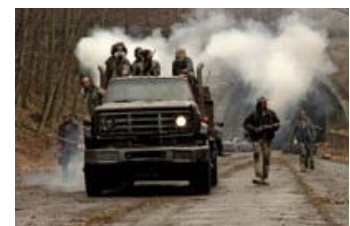
Fig. 4: En af filmens forcer er de store supertotale af landskaber, der nærmest driver og drypper af død.