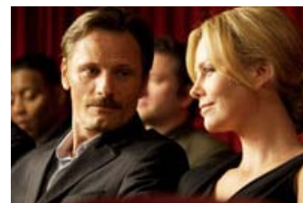
Fig. 6-7: Disse to stills er eksempler på, hvordan 'livet før' erindres af fortælleren/faderen. Lyset, der (som antydtes ved Fig. 5) minder om balscenerne efter katastrofen, er varmt, og den smukke hustru er et fotogent centrum i dem alle. Hun er dog langt mere interessant i scenerne efter katastrofen.