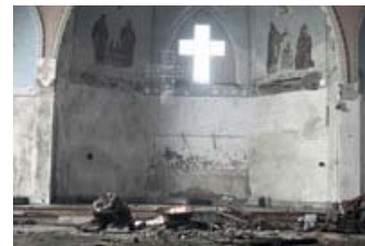
Fig. 13: Også det guddommelige rum er ruinøst i The Road , hvor kirken blot tjener som midlertidigt læskur på linje med presenninger og forladte fabrikker.

The Road havde dansk premiere d. 28. januar 2010.