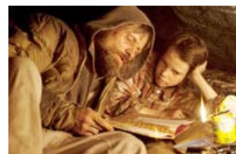
Fig. 5: Faderen forsøger intenst at give drengen smuler af en normal barndom. Her læser han godnathistorie (men med pistolen inden for rækkevidde). Denne og lignende scener efter katastrofen er med det gullige, bløde lys påmindelser om livet før, som vi møder i flashbacks og drømme.

Jeg startede anmeldelsen med at påpege fraværet af ting. Den