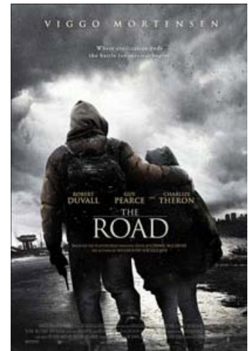
Fig. 1: Traileren til The Road sælger nok filmen, men er også vildledende markedsføring. Se den her

Det absolutte forfald og knapheden på mad, vand, tøj, ammunition – ja, alle den præapokalyptiske verdens ting – indvirker på alle mellem menneskelige relationer, også internt mellem de 'gode mennesker'. En af filmens fine pointer er også, hvordan den gråhed, der gennemsyrrer det ydre, indtager alle overlevende og udfordrer de skarpe grænser mellem ondt og godt, sort og hvidt. Ikke alle stiller sulten i menneskekød, men alle beskytter i overlevelsens navn de smuler, de har. Faderen gør alt for at beskytte sin dreng og sikre hans overlevelse. I den proces bliver grundlæggende humanistiske og