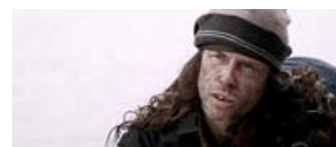
Fig. 8: Det kan dog afsløres, at vi til slut møder Guy Pearce, der endnu en gang demonstrerer sin evne til at ændre udseende. Aldrig er han set så grim. God eller ond? Se filmen.