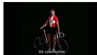
Fig. 8: Endnu et eksempel på 'vanvittig katalogisering'. I Livet i Danmark kan man næsten høre Leths stemme i underteksterne.