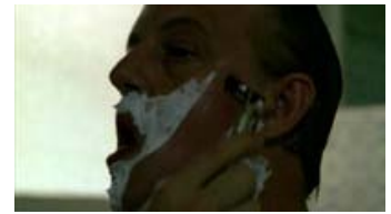
Fig. 10: Her ses barberingsmotivet igen i Udenrigskorrespondenten .