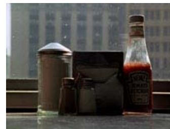
Fig. 5: Hos Leth benyttes voice over-speaken og underteksterne ofte blot til redundant at påpege hvad vi ser i billedet.