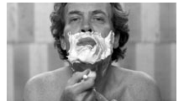
Fig. 11: Barberingsmotivet igen. Her i Notater om kærligheden .