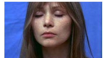
Fig. 3: Den sjette DVD-boks omfatter bl.a. størstedelen af Leths tidlige produktion. Her Ofelias Blomster .