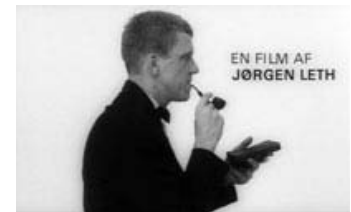
Fig. 2: Det perfekte menneske undersøger ikke kun hvad et menneske er, men også hvad filmmediet er.