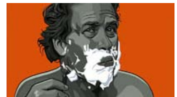
Fig. 12: Og igen i De fem benspænd .