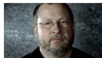
Fig. 14: Lars von Trier udtaler sig ikke udelukkende positivt om Leth i DVD-boksens ekstramateriale.