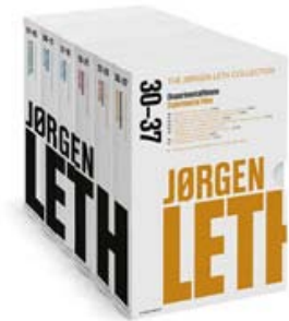
Fig. 1: Her ses hele herligheden: alle Leths film samlet på seks DVD-bokse.

Allerede Leths første film, Stopforbud , som handler om jazzpianisten Bud Powell, fremviser et af de træk som er genkommende på tværs af Leths filmiske œuvre – eksperimentet med forholdet mellem billede og lyd (fig. 4). Lyd og billede er for Leth ofte to adskilte størrelser: snarere end at arbejde sammen om at skabe en filmisk virkelighedsillusion, modarbejder lyd- og billedsiden ofte hinanden.