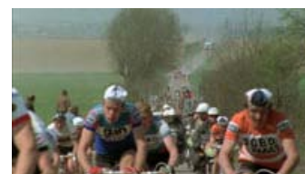
Fig. 15: Cykelrytternes strabadser i En forårsdag i Helvede .