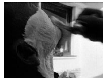
Fig. 6: Et yndet motiv hos Leth er barberingsmotivet.