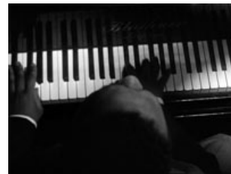
Fig. 4: Vi ser og hører Bud Powell spille samtidig, men lyd og billede følges alligevel ikke ad.

Derudover foregår repetitionen både på et tematisk indholdsmæssigt plan, på et motisk plan og på et filmstilistisk plan. Der er visse