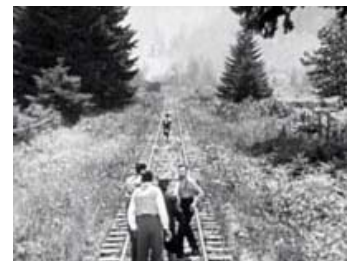
Fig. 10: Johnnys vedholdenhed gøres komisk via tidslig udstrækning og rumlig ekspansion.