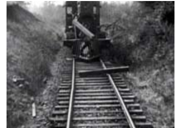
Fig. 8: Johnny løser to problemer på én gang: Han kommer af med den bjælke, som vejer ham ned ved at benytte den til at støde en anden – potentielt afsporende - bjælke af skinnerne.