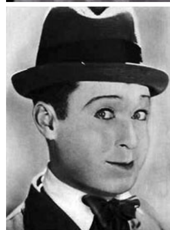
Fig. 3-6: Buster Keaton, Charles Chaplin, Harold Lloyd og Harry Langdon.