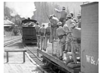
Fig. 9: Uvidende drager Johnny alene af sted på redningstog.