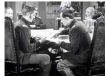
Fig. 2: Generalerne løfter dugen for at slukke den cigarpåtændte ild. Keaton viser i én indstilling Johnnys gemmested samt generalernes uvidenhed om dette.