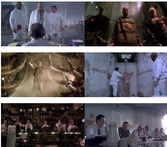
Fig. 13-18: Spejling i tid. Fængslets fangevogtere afløses af vagter på sindssygehospitalet, den kemiske rens af den nøgne krop udskiftes med et spulebad op ad den psykiatriske institutions gustne klinker og rækken af videnskabsfolk bliver til et panel af psykiatriske eksperter.

Helt i filmens ånd problematiseres denne klare skelnen mellem de to virkeligheders sandhedsværdi selvfølgelig til stadighed. Endeligt tvinges Cole, såvel som tilskueren, derfor til at forkaste enhver påstand om primære og sekundære virkeligheder. Filmens forskellige tidslige rum flyder sammen og Coles oplevelser i den ene parallelle verden afspejles, indholdsmæssigt og visuelt, i den anden (fig. 13-18):