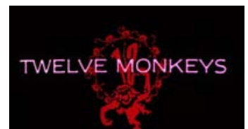
Fig. 8: Monkey business. Filmens vartegn er en stor, fjollet, cirkuslignende abe, der jonglerer med elleve mindre aber. Tilsammen danner de rammen om en urskive, der indeholder to zigzaggende visere og et ekspressionistisk forvrænget 12-tal. Aberne kan med rette ses som urets tolv lige klokkeslæt, der danser ustyrligt omkring – og vartegnet som et sindbillede på filmens behandling af tidsbegrebet.