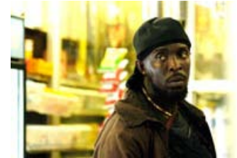
Fig. 5: Samfundskritikken lurer som en klar humanistisk understrøm i Simons barske, upolerede føljeton om kriminalitet og elendighed blandt marginaliserede samfundsgreupper.