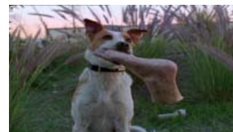
Fig. 11: Som led i seriens kunstneriske indskrivelsesproces refereres der også eksplicit til både Kurosawa og Lynch. Billedserie: Wild at Heart (1991), Yojimbo (1961), Six Feet Under (1:3, 2001).