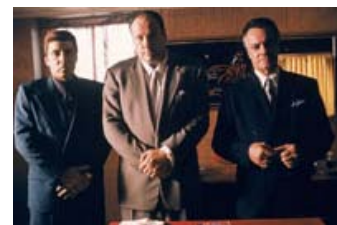
Fig. 2: Billedpar: The Sopranos ligner i flere henseender en televisuel pendant til Martin Scorseses veldrejede gangsterdrama Goodfellas (1990).