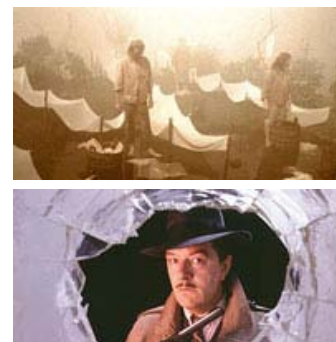
Fig. 9: Serier som Six Feet Under , The Sopranos og The Wire lægger sig i naturlig forlængelse af dristige europæiske serier som Riget (1994) (øverst) og The Singing Detective (1986) (nederst). Serier, der allerede har fået prædikatet "art TV".