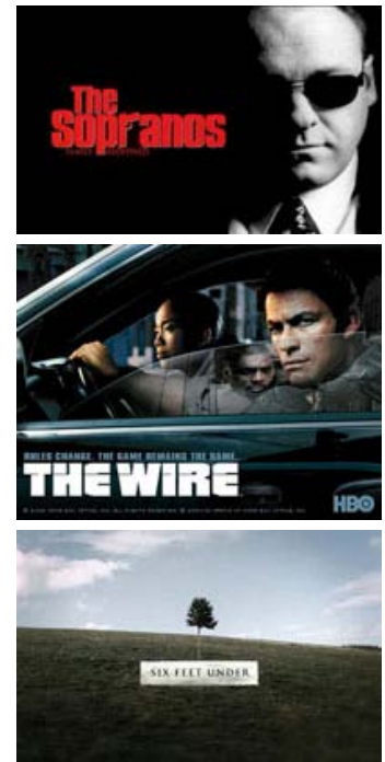
Fig. 1: Billedserie: Med serierne The Sopranos , The Wire og Six Feet Under synes betalingskanalen HBO at have indledt en ny, og tredje guldalder inden for amerikansk Tv-fiktion.

Men mens The Sopranos er anerkendt, nyder bred popularitet og i 2001 kunne bryste sig af at være genstand for en retrospektiv visning af sæson 1 og 2 på MOMA i New York, så har vejen til anerkendelse været noget mere ujævn for The Wire . Kritikerne har heppet hele vejen til mål, men serien vandt aldrig en Emmy, ligesom den kun havde i omegnen af 4 millioner seere mod The Sopranos' næsten 15 millioner (helt uhørt for betalings-tv), da bølgerne gik højest. Men – som allerede skrevet – den grundlæggende ambition var den