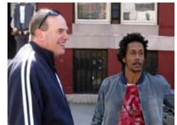
Fig. 4: Skaberen, David Simon, på settet af det kradse cop- og storbydrama The Wire .