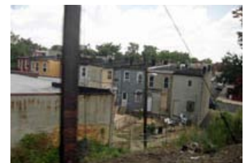
Fig. 6: Ved siden af det store ensemblecast, som serien udgøres af, spiller også Baltimore, som depraveret, forfalden storby, en central rolle. De kollektive og samfundsmæssige forhold synes, i den forstand, væsentligere hos David Simon end individer og personpsykologiske perspektiver.