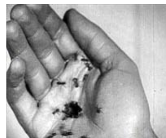
Fig. 10: Six Feet Under er blevet betegnet som "primetime surrealism", og referencerne til Buñuel er da også slående. Billedpar: Six Feet Under (2001) og Un chien andalou (1929).