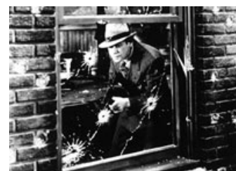
Fig. 7: Den grænseoverskridende skildringsform, på kant med produktionskoder og puritanske regulativer, har altid knyttet sig til gangstergenren. I billedet ses Paul Muni i én af filmhistoriens mest omstridte og vellykkede gangsterfilm: Scarface (1932).

En fugl, øjensynligt en ravn eller en krage, krydser en matblå himmel. Kameraet tilter ned og afslører nu et enkeltstående træ (med næsten bibelske konnotationer). Der klippes til et nærbillede af to hænder, som i slow motion, og i nøjagtig synkroni med musikkens fraseringer,