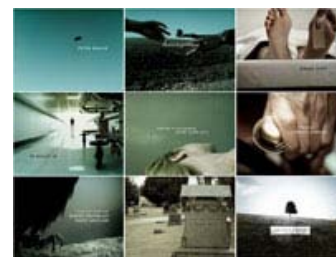
Fig. 8: Åbningsmontagen i Six Feet Under , udført af selskabet Digital Kitchen, etablerer seriens stil og miljø på anderledes abstrakt og metaforisk vis end i den klassiske føljeton.