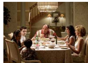
Fig. 3: Psykologisk familiedrama, komedie, voldsæstetik eller grotesk samfundskritik? The Sopranos krydser grænserne imellem flere forskellige genrer, temaer og iscenesættelsesformer.