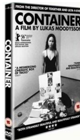
Fig. 1: Lukas Moodyssons Container er ikke udgivet i dansk distribution, men den findes i denne engelske udgivelse fra Metrodome.

I den klassisk fortalte film, som har sin rod i Hollywoods fortællestil og er blevet behandlet af blandt andre David Bordwell, udgøres filmens kerne typisk af en målorienteret handling, i hvilken karakterer søger at opfylde specifikke mål og undervejs støder ind i konflikter og hindringer, der kan forpurre disse mål. Denne tilgang er åbenlys i Moodyssons tidlige værker. I Fucking Åmål forsøger pigerne Agnes og Ellen at få mere ud af livet, end hvad lillebyen Åmål kan tilbyde. (fig. 4). Samtidig kæmper Agnes med en homoseksualitet, som ikke just er hverdagskost i det lille samfund. Tilsammans har nærmere en gruppe som protagonist, idet filmen kredser om et 1960'er-kollektiv, hvor gruppen har som mål at danne en alternativ livsform til den dominerende, borgerlige eksistens (fig. 5).