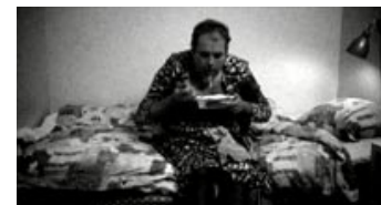
Fig. 2: Åbningsbilledet i Container . En fed mand spiser en færdigret direkte ud af foliebakken.