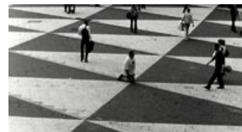
Fig. 10: Ude blandt mennesker hører vores protagonist i hvert fald ikke hjemme.