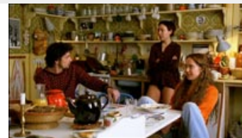
Fig. 5: Tre af kollektivets beboere i Tilsammans diskuterer, om det nu også går an at diskutere, når den ene af dem ikke har nogen trusser på.

Dette er dog ikke nødvendigvis nogen rigtig endsige relevant konklusion. Det er nemlig kun få steder i filmen, at voice-overen direkte taler om noget, der optræder i billedet. Det meste af tiden fungerer Jena Malones voice-over som en heterodiegetisk rammefortæller, der ikke selv har nogen del i historien, men mest af alt bidrager med en melankolsk og til tider dystopisk stemning. Denne stemning kreeres dels af stemmens trætte udtryk og dels af de temaer, den Howl-inspirerede tale kredser om; nukleare ulykker, fedme, forbrugersamfundets vulgaritet, kræft, død, krig og ikke mindst seksualitet i alle dens afskygninger. Det er temaer, som Moodysson også har behandlet i sine tidligere film, og Container kan således siges at have et tematisk slægtskab med resten af Moodyssons oeuvre, især hvad gælder de vanskeligheder et individ har ved at passe ind i et samfund. Vanskeligheder som er knyttet til seksuelle eller sociale afvigelser fra normen. Ligesom Agnes i Fucking Åmål , Tess i Et Hul i mit Hjerte og flere af karaktererne i Tilsammans har Containers