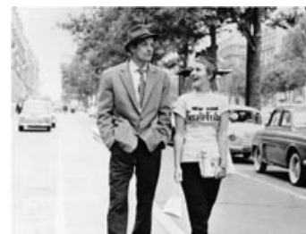
Fig. 6: Jean-Luc Godards À Bout De souffle fra 1960 er blandt mesterværkerne i art-cinema-traditionen.