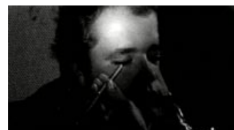
Fig. 11: Kun oplyst af en lommelygte synes protagonisten her totalt isoleret i sit afsondrede liv.