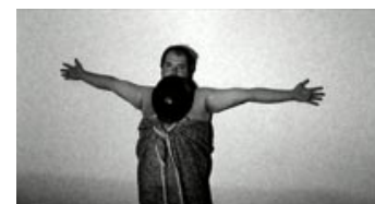
Fig. 3: Den næste billede er endnu mere besynderligt. Manden står nu op af væggen med en militærhjelme i munden.