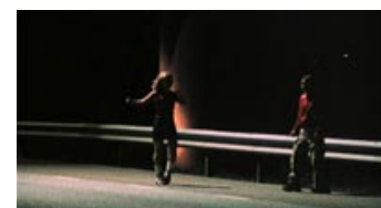
Fig. 4: Agnes og Ellen forsøger forgæve at blaffe sig ud af Fucking Åmål .