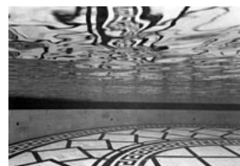
Fig. 13: Maya Derens Meshes of the Afternoon (1943) har samme lyriske filmsprog, som man stedvist finder i Container .