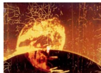
Fig. 14: Tematisk hænger Container sammen med Stan Brakhages Dog Star Man