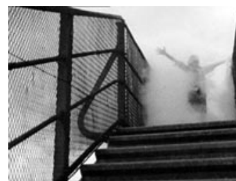
Figur 4: I røg og damp fra det larmende tog kan Jamie holde sit eget trostesløse liv på afstand. Toget, der passerer under broen, kunne tillige være en vej ud af elendigheden.