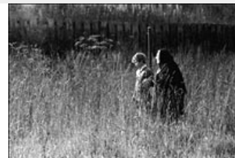
Figur 3: Jamie med sin mormor.

Endelig benytter filmen sig af et symbolsprog, der kan være svært at få