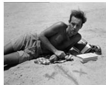
Fig.5: Scenerne fra Egypten er filmet på samme måde som resten af filmen. Alligevel mærker man en særlig interesse for den fotogene mandekrop.