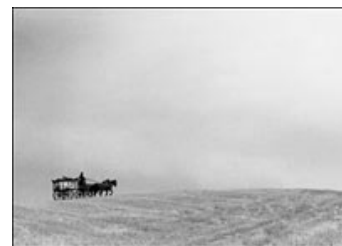
Fig. 6: Et eksempel på den nøgne æstetik.