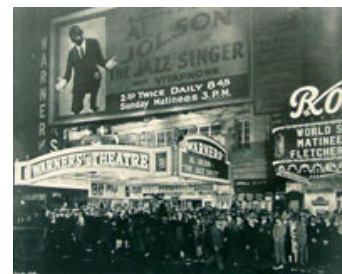
Fig.1. The Jazz Singer (1927) regnes ofte som den første egentlige lydfilm. Men som en part-talkie – primært bestående af diegetisk musik og sang – var denne film næppe revolutionerende i nogen æstetisk forstand.