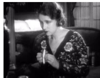
Fig.14-16. Legen med audiovisuelle mismatches og illusionsbrud er kendetegnende for tidlige lydfilm af Chaplin, Clair og Buñuel. Billedserie: Le Million (1931), Modern Times (1936) og L'Âge d'or (1931).