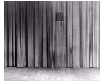
Fig.10. Mabuses stemme høres konsekvent gennem et forhæng. Dette giver skurken et magisk og næsten almægtigt tilsnit – ganske som vi kun oplever Gud gennem Ordet. Billede: Das Testament des Dr. Mabuse (1933).