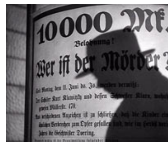
Fig.5. Den ikke-visualiserede stemme skaber dels suspense – idet vi ikke kender manden bag stemmen – og samtidig uhygge. Ikke mindst i kraft af den ubehagelige inkongruens imellem den voldsomme skygge og den pibende stemme. Billede: M (1931).

At Mabuse – som allerede blev etableret i stumfilmen Dr. Mabuse, der