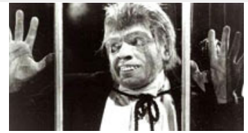
Fig. 12. I Dr. Jekyll & Mr. Hyde (1932) opleves måske filmhistoriens første syntetiske lydspor – her benyttet mhp. at spejle den visuelle overgang fra Jekyll til Hyde.

Som aktivt filmpublikum er vi – grundet en række fortælle tekniske konventioner – inklinerede til at stole på den kausale sammenhæng imellem billede og lyd. Oplever vi en lyd, som nogenlunde modsvarer