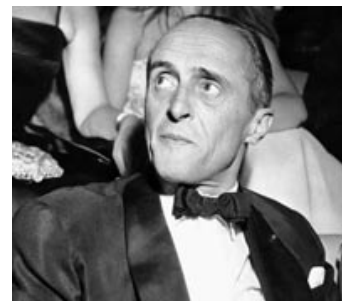
Fig. 2. Som debattør var René Clair skeptisk ift. lydens gennembrud, men som instruktør var samme Clair en bestemmende faktor for netop den tidlige lydfilm.