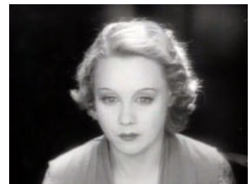
Fig. 11. Den forvrængede tale benyttes i Blackmail (1929) som et psykologisk motiv.