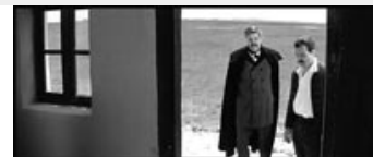
Fig. 14: Ligene ligger lige inden for døren – uden for vores synsfelt.

Denne bravureffekt er der ikke hos Jancsó. Stilistisk er filmen snarere spartansk – fx er den med undtagelse af indledning og afslutning fuldstændig rensat for underlægningsmusik. Jancsó appellerer snarere til tilskuerens tålmodige og intense blik. De adstadige kamerakørsler og det adstadige klippetempo er her så virkningsfulde, fordi de synes i pagt med tidens rytme. Desuden er kameraets kringelkrogede