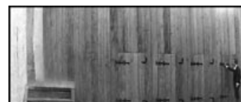
Fig. 11: I silende regn afprøver Dolmányos, om dørene er åbne.