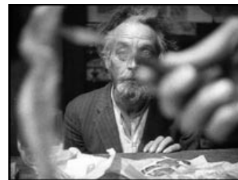
Fig. 7-8: Dette spring direkte ind i interaktionsaksen a la Yasujiro Ozu sker også ved Helius' samtaler med hhv. Turner og Friede – dog uden den direkte p.o.v. markering, som ses her ved skinkens placering i billedfeltet.