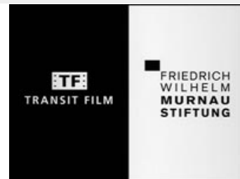
Fig. 3: F.W. Murnau-Stiftung anvender selskabet Transit Film til at udgive og distribuere deres restaurerede film på DVD. Som ved andre tyske stumfilmsklassikere har det britiske selskab Eureka købt licensen til salg i UK og Irland af Transit Film.

Gunnings problemer med at holde sig vågen under filmen, kan jeg godt genkende, og filmens spilletid på 163 minutter synes unødvendig langtrukket. Faktisk går der godt 90 minutter, før rumraketten sendes af sted. Var disse 90 minutter forvaltet med den samme sans for suspenseopbygning som ved nedtællingen, ville det ikke være noget problem, men filmen synes flere steder at træde vande i disse passager. Filmen bruger for lang tid på at udfolde forholdet mellem Helius, Windegger og Friede samt på at flette finanssyndikatet ind i fortællingen om ekspeditionen. Jeg er til gengæld ikke helt enig i Tom Gunnings udlægning af Frau im Mond som en film, der tilsidesætter karakterskildring til fordel for "spectacle of technology" (Gunning 2000, s. 173). Teknologifascination og den tilknyttede grafiske og spektakulære billedfabrikation er der ganske vist i rigelig mål (fig. 4-5),