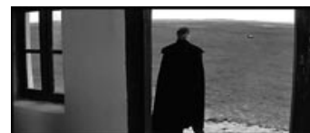
Fig. 15: Pusztá en er re-funktionaliseret fra at være frihedens landskab til at være et landskab, hvorfra der ikke findes nogen flugtmulighed.