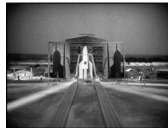
Fig. 4-6: Filmens rig på grafiske illustrationer af månefart, illustrationer af tekniske procedurer og spektakulær teknologi.