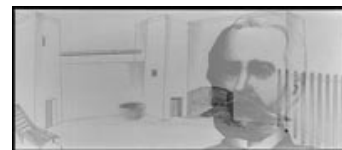
Fig. 10: Ved omtalen af Radays ansvarsområde vises illustrationer af fangelejren og henrettelsesredskaber.