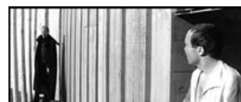
Fig. 12: Solskin på den anden side af cellen.