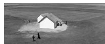
Fig. 13: Den ældre kvinde ses til venstre i billedet.