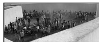
Fig. 16: Ét af flere tilfælde hvor tilskueren betragter begivenhederne oppefra. Se også fig. 13.

Efter at have stiftet bekendtskab med udgivelserne af Frau im Mond og The Round-Up , må konklusionen altså være, at selvom en månerejse nok lyder eventyrlig, så er en tur til den ungarske slette at foretrække.