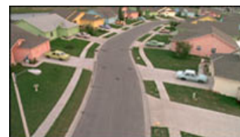
Fig. 2: Vi har tidligere bragt en artikel om Tim Burtons brug af farver i Edward Scissorhands .