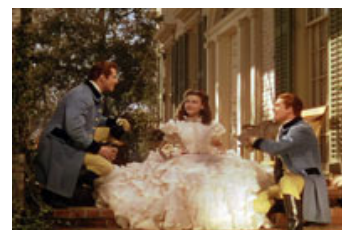
Fig. 6: Scarletts kjoler: I filmens indledning optræder Scarlett i en hvid kjole, der etablerer hende som ung og uskyldig. Som bekendt varer uskyldigheden ikke ved, ligesom den hvide kjole ret hurtigt skiftes ud med kjoler i langt heftigere farver.