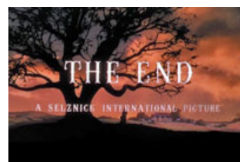
Fig. 7: Fra GWTW 's afsluttende scene: Farverne får trods alt det sidste ord.