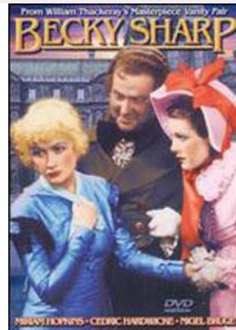
Fig. 4: Becky Sharp (Rouben Mamoulian, 1935).

Higgins benytter den midterste del af sin bog til, gennem en række meget grundige analyser, at vise hvordan denne tilbageholdende æstetik kom til udtryk i film som Henry Hathaways The Trail of the Lonesome Pine fra 1936, men også til at påpege hvordan tilbageholdenheden åbnede mulighed for, med meget små virkemidler, at sætte farven i spil som et betydningsbærende element. Han viser ligeledes, hvordan udviklingen langsomt men sikkert bevægede sig fra tilbageholdenhed mod stadig mere ekspressive forsøg på at udfolde nogle af farvepalettens utallige muligheder. I George Marshalls musical The Goldwyn Follies (1938) og i A Star Is Born (William A. Wellmans 1937-udgave) er der forskellige alibier for at udbrede paletten. I Wellman's film skrues der f.eks. gevaldigt op for farvestyrken, da filmens hovedperson ankommer til drømmenes men også mareridets Hollywood, ligesom "...the tremendous expansion of the palette" (ibid, s.120) meget direkte peger tilbage på den overfladiskhed, der hersker i filmbyen.