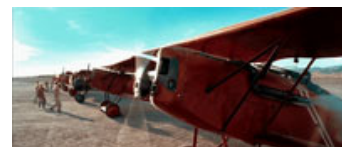
Fig. 9: Scorseses The Aviator i two-color udgaven.