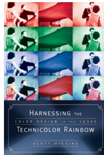
Fig. 1: Scott Higgins: Harnessing the Technicolor Rainbow; Color Design in the 1930s , University of Texas Press 2007.

I en kort periode i midten af årtiet gjaldt det for Technicolor og ikke mindst for de producenter, der dækkede de betydelige ekstraudgifter, valget af farvefilm medførte, om at vise muskler: Hvad kan farver på film, og hvordan adskiller farvefilmen sig fra den sort/hvide film. Kort sagt, hvad får man for pengene? Det var et spørgsmål såvel producenter som publikum stillede sig selv og kortfilmen La Cucaracha