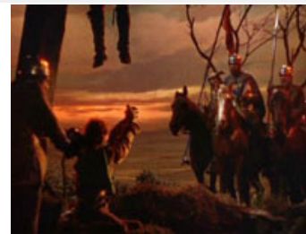
Fig. 5: Der er knald på farverne i Curtiz' The Adventures of Robin Hood . Allerede på manuskriptstadiet sikrede mr. Warner sig, at farverne kom til at spille en fremtrædende rolle i filmen.