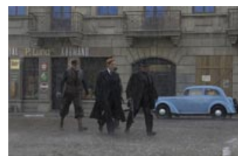
Fig.4: Regnfuld noir-stemning, smukt indfanget af filmens fotograf, Jørgen Johansson.