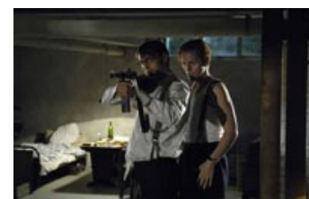
Fig.2: Flammen og Citronen i skikkelse af Thure Lindhardt og Mads Mikkelsen.