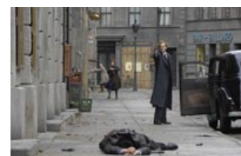
Fig.1: Filmens mange likvideringer er ikke just præget af diskretion.