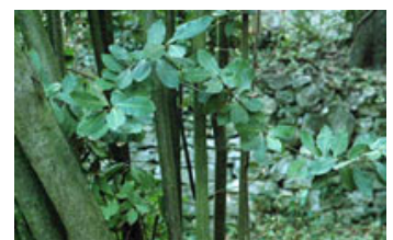
Fig. 20. Slutmotivet.