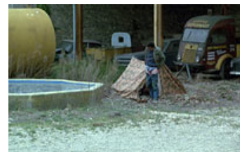
Fig. 3-5. Kausal kortslutning.