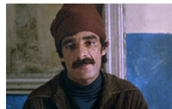
Fig. 26. Assoun.