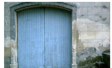
Fig. 17-18. Mange af motiverne summer tilmed af betydningspotentiale. Se også fig. 13-15.