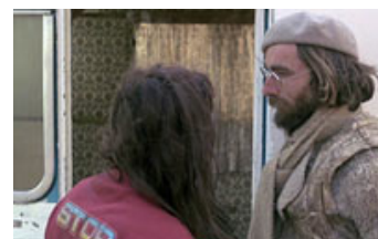
Fig. 8. Mona viser ingen interesse i at dyrke jorden eller i at "holde hus" og kommer derfor på kant med Berger. Fælles for de fleste af Monas bekendtskaber er, at de på den ene eller anden måde forsøger at komme hende i møde eller "indlemme" hende. Fælles for dem er ligeledes, at det mislykkes.

Fig. 7. Mona er tydeligt såret over at blive afskåret fra bondefamilien, da hun får tildelt en campingvogn som domicil – markeret ved et spyt ud af vinduet. Ligeledes fornemmer man ærgrelse, da professor Landier (Macha Mériel) må efterlade hende i bilen, mens Landier tager til konference.