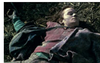
Fig. 1. Monas endeligt - filmens begyndelse.

Ligesom filmen aldrig fortæller os, hvor Mona er på vej hen, så forbliver hendes bevæggrunde ligeledes (næsten) uforklarede. Fx trodser hun de forventninger, der knytter sig til en person af hendes sociale status: Vi ser Mona som bloddonor, men hun donerer hverken for mad, vin eller penges skyld (fig. 2). Filmens opbygning sågar en forventning om bestemte kausale koblinger for umiddelbart derefter at kortslutte dem: I en scene på et bilværksted deler Mona et på én gang vidende og flirtende blik med en ung mekaniker, men få indstillinger senere er det mekanikerens far, der træder ud af hendes telt med bukserne nede om anklerne (fig. 3-5). Det mest sigende eksempel på Monas uforklarede