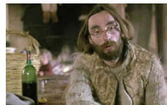
Fig. 27. Bergers øjne flakker et kort sekund