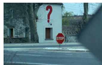
Fig. 12. Stop?. Indklippet kan også sættes i relation til filmens kompositionelle spil med forgrund og baggrund.