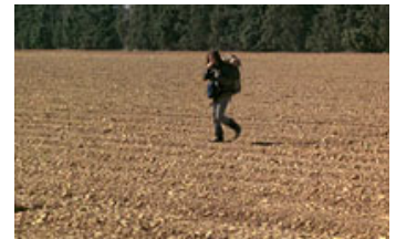
Fig. 16. Kamera og Mona bevæger sig mod venstre. Statistiske undersøgelser indikerer, at højrevendte kamerabevægelser forekommer hyppigere end venstrerettede (se O'Leary 2003; Salt 2005).

(2) Citatet er oversat til engelsk i Bacher (1978, s. 229).