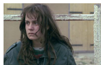
Fig. 6. Mona fælder en tåre.

(1) Horst Ruthrofs betegnelse er gengivet i Bordwell (1985, s. 208).