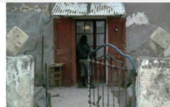
Fig. 21. Den stilistiske stringens kommer fx til udtryk i symmetriske og planimetriske indstillinger og i de mange præcise klip langs kameraets akse.

De små registerskift, som udspiller sig i disse forskellige former for direkte henvendelse, er sigende for den oplevelsesform, som filmen fordrer. Hverken fortællerinstansens eller karakterernes henvendelsesform er givet på forhånd og derfor er også tilskuerpositionen konstant i spil. Med andre ord så er Sans toit ni loi i besiddelse af en omskiftelighed, som bevirker at det er svært at få 'greb' om filmen – egentlig meget lig det forhold som filmens karakterer har til Mona. Det kan være frustrerende, men betyder også, at man aldrig bliver 'mæt' af filmen. Som andre af kunstfilmens hovedværker bliver den ved med at være dragende og giver noget nyt fra sig ved hvert gennemsyn.