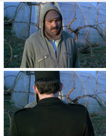
Fig. 10-11. Også i orkestreringen af figurbevægelse ligger der redaktionelle kommentarer, som her da en politibetjent visuelt udraderer gæstearbejderen fra billedrammen. Dette sker netop ikke, når politiet interviewer de hvide bønder.

Man kan altså spore alle disse fem parametre i hver kamerabevægelse. Først og fremmest er der en anden henvendelsesform på spil. Kamerabevægelserne giver ikke umiddelbart fortællelemæssig