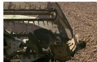
Fig. 13-15. Dette er slutmotivene i de tre første kamerabevægelser.