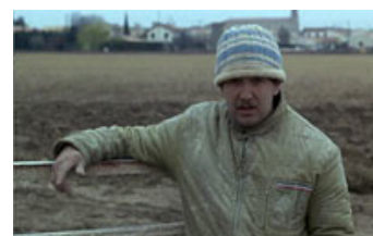
Fig. 25. En murer taler til kameraet, som er han et af de vidner, Varda opsøger for at få svar om den nu afdøde Mona.