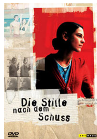
Fig. 16: Hovedkarakteren Rita skifter identitet, men er hele vejen igennem et idealistisk menneske, der er drevet af ædle motiver.