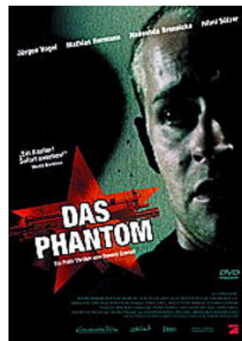
Fig. 10: Findes den såkaldte 3. generation af RAF overhovedet? Dennis Gansels Tv-film er et must for sammensværgelsesteoretikere.