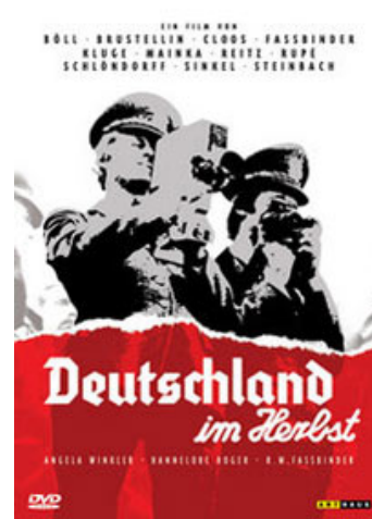
Fig. 9: Deutschland im Herbst . Indtryk fra et land i mental krise.