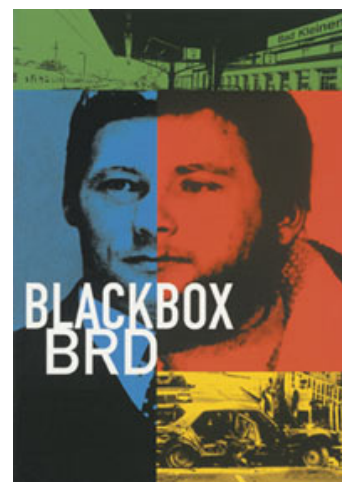
Fig. 12: To tyske skæbner. Alfred Herrhausen fra Deutsche Bank og Wolfgang Grams, den formodede morder.

Hvilken film er sluppet bedst fra at tematisere terrorismen i Tyskland? Spørgsmålet er naturligvis absurd. Hver generation vil fortælle sin version af historien. I de kommende år vil de mange talentfulde, unge tyske instruktører give deres personlige version.