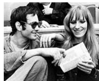
Fig. 3: Andreas Baader og Gudrun Ensslin, Terrorismens svar på Bonnie & Clyde.