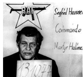
Fig. 7: Virkelighedens Hanns Martin Schleyer i RAF-terroristernes 'folkefængsel'.