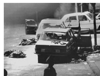
Fig. 2: RAF's bortførelse af den tyske arbejdsgiverpræsident Hanns Martin Schleyer den 5. september 1977 er startskuddet til Det Tyske Efterår.