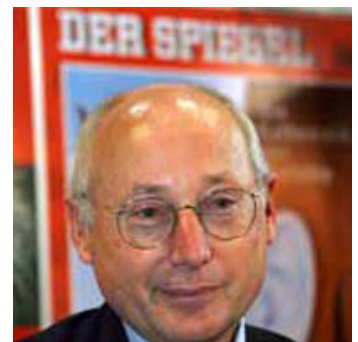
Fig. 5: Stefan Aust, chefredaktør for Der Spiegel og manden bag det kanoniske standardværk om RAF.