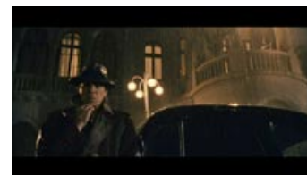
The Black Dahlia (2006).