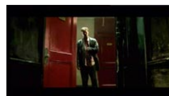
Fig. 4. Den trøstesløse storby i Se7en understreges af filmens meningsfyldte brug af et opdateret noir-stilregister.