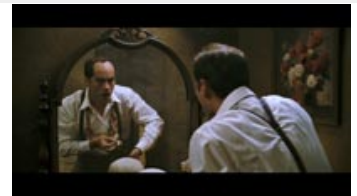
Fig. 7. Ray uden toupé . Falskheden understreges med den for noir-genren så typiske spejlmetaforik.

Filmen spiller så meget op mod vores genrebaserede forestillinger om noir-helten, så i nogen grad tjener disse brud netop til at markere genrens konventioner – lidt som genreparodiens underminering af genrens klichéer i sidste ende også netop stadfæster dem. Og der er da også noget umiskendeligt noir over Simos ubestikkelige integritet (der helt i overensstemmelse med genrens traditioner sameksisterer med hans lurvethed) og den måde, han tager sine tæsk og nederlag uden at kny, og både nederlag og tæsk er der nok af.