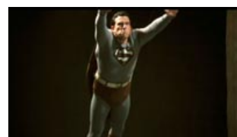
Fig. 15. Reeves i rollen som bliver hans forbandelse.