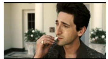
Fig. 9. Post-noir: den hårdkogte detektiv ligner ikke længere sig selv valget af Brody er et effektfuldt eksempel på casting mod type.