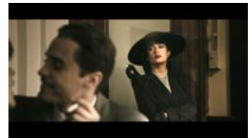
Fig. 8. Den mørke femme fatale tårner sig op og stjæler fokus fra den ubekymrede og ubekymrede Ray i forgrunden.