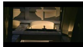
Fig. 1. Klassisk De Palma håndværk, men måske mest en gentagelse af tidligere tiders bedrifter?!

Så på trods af filmens lækre (men altså hverken videre originale eller funktionelle) noir-look, flere fine øjeblikke og den omstændighed, at man generelt er udmærket underholdt, så forbliver helhedsindtrykket,