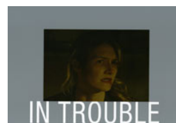
Fig. 1-3. Den komplette tekst lyder: "A STORY OF A MYSTERY... A MYSTERY INSIDE WORLDS WITHIN WORLDS... UNFOLDING AROUND A WOMAN... A WOMAN IN LOVE AND IN TROUBLE"