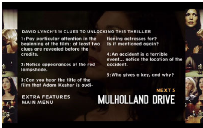
Fig. 5. De ti opklaringsspor til Mulholland Drive .

sanselige slagkraft – og alt for ofte ses som ualmindeligt kryptiske kriminalmysterier, der skal vendes og drejes, genses og granskes for i sidste ende at afdække den egentlige sammenhæng mellem begivenhederne i de enkelte film. Jeg har eksempelvis altid fundet det paradoksalt, at desto mere Lynch forsøger at give slip på den sammenhængende intrige, og desto mere sanserbombarderende hans film er blevet, desto mere synes hans fortolkere at kvittere ved at tage luppen i hånden og gå på opdagelse efter de skjulte spor i fortællingen. Helt sikkert foranlediget af Lynch selv, der bevidst lægger i ilden til dette fortolkningsspil, når han med en fuldblodsfasination for fyrrernes mørke noir-tradition præsenterer sine film som mysterier med en både mystisk og gådefuld kerne. Eller måske mere direkte, når han i forbindelse med tv-genudsendelsen af Twin Peaks lader The Log Lady introducere hvert afsnit med en kryptisk formuleret gåde, når han på dvd'en til Mulholland Drive giver 10 "clues" til filmens mysterium (fig. 5), eller når han i forbindelse med pressearbejdet på INLAND EMPIRE opretter et forum på filmens hjemmeside, hvor man kan diskutere, hvordan de forskellige plotstumper hænger sammen.