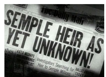
Fig. 5: Avisforside fra starten af "Mr. Deeds Goes to Town".