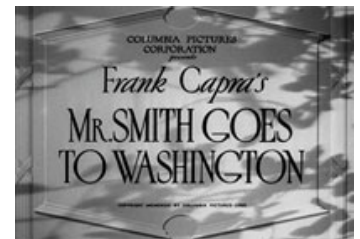
Fig. 2: The Name Above the Title, "Frank Capra's Mr. Smith Goes to Washington".