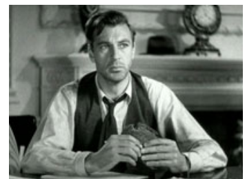
Fig. 10: Gary Cooper som Longfellow Deeds.