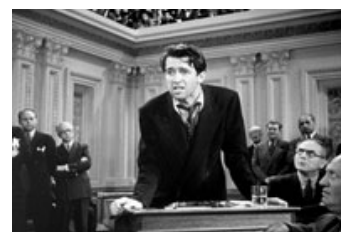
Fig. 23: Senator Smith (James Stewart) under sin sejrige filibuster kraftpræstation