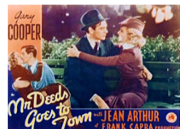
Fig. 4: Plakat fra "Mr. Deeds Goes to Town" (1936).