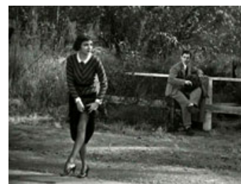
Fig. 19: Rigmandspigen Ellen Andrews (Claudette Colbert) stopper en bil uden brug af tommelfingeren.