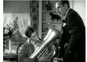
Fig. 7: Gary Cooper som Longfellow Deeds og Douglass Dumbrille som advokaten John Cedar i "Mr. Deeds..."