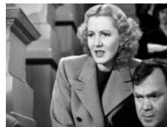
Fig. 24: Saunders (Jean Arthur) og Diz Moore (Thomas Mitchell) følger Smiths filibuster fra tilhørerpladserne i senatet.

i "Mr. Smith Goes to Washington" (1939).