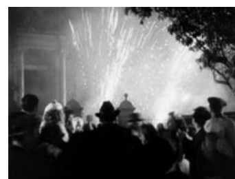
Fig. 14: Aftenen ender med eksplosioner, og begge familier arresteres af politiet.