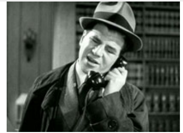
Fig. 6: Lionel Stander som Cornelius Cobb i "Mr. Deeds..."

Filmen "You Can't Take It With You" fra 1938 stiller i et skævt og rablende toneleje sagen på spidsen ved at modstille en jævn og kugleskør familie bestående af lutter godhjertede excentrikere med en trist rigmandsfamilie uden anden glæde i livet end at se bankbogen vokse til ingen nytte (fig.12). Filmen er blevet kaldt den første screwball comedy , og skør er den, med en ofte vittig og slagfærdig dialog, og med et persongalleri i den muntre familie, der udfolder sig med balletdans, musikopræden, fyrværkerifremstilling og sære masker