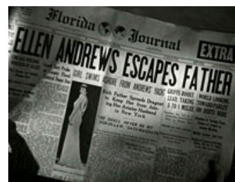
Fig. 20: Datteren Ellens flugt fra sin rige far giver anledning til store avisoverskrifter.