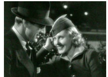
Fig. 9: Gary Cooper og Jean Arthur i "Mr. Deeds Goes to Town" (1936).