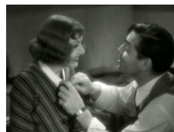
Fig. 17: Claudette Colbert og Clark Gable i "It Happened One Night" (1934).