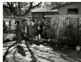
Fig. 21: Med en lang køretur følger kameraet rigmandspigen Ellen (Claudette Colbert), da hun vil have et brusebad i "It Happened One Night" (1934).