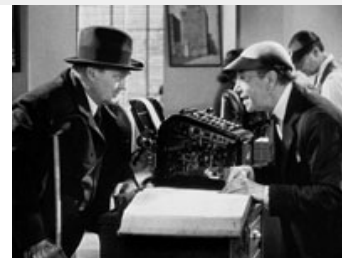
Fig. 12: Lionel Barrymore (til venstre) og Donald Meek i "You Can't Take It With You" (1938).

Ud over kærlighedshistorien og enkelte pikante scener (mest direkte, da Claudette Colbert ruller kjolen op og viser lår) tror jeg, at filmens hovedattraktion i samtiden har været at se rigmandsdatteren og bladsmøreren – spillet af nogle af de mest kendte filmstjerner – bragt