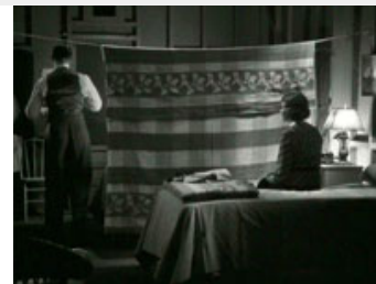
Fig. 18: Clark Gable og Claudette Colbert i "It Happened One Night". Parret må dele hotelværelse og hænger et tæppe op mellem de to senge. Adskillelsen kaldes i filmen "The Walls of Jericho", og i slutscenen låner Peter Warne (Clark Gable) en trompet og blæser muren ned, så de to kan forenes.

Baggrunden for instruktøren Frank Capras stjernestatus i 1930'erne og 1940'erne er en serie film, der i samtiden blev formidable publikumssuccesser – og som for størstedelens vedkommende har klassikerstatus den dag i dag. Capra finder i løbet af 1930'erne en magisk formel for succes med en serie satiriske, sociale og romantiske komedier, der ofte fremhæver den jævne mands ligefremhed, sunde fornuft og ærlige moral på bekostning af den rige og magtfulde overklassens falskhed og forstillelse. Særligt berømte i den forbindelse er to film fra 1930'erne,