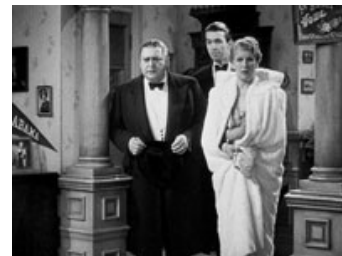
Fig. 13: Familien Kirby kommer på besøg hos familien Sycamore.