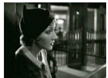
Fig. 3: Claudette Colbert i "It Happened One Night" (1934).