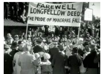
Fig. 8: Mandrake Falls tager afsked med byens stolthed, Longfellow Deeds.