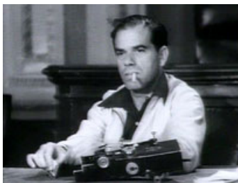
Fig. 25: Filminstruktøren Frank Capra, cirka 1939.

"Mr. Deeds Goes to Town" fra 1936 og "Mr. Smith Goes to Washington" fra 1939 – senere fulgt op i 1940'erne med navnlig "Meet John Doe" fra 1941 og "It's a Wonderful Life" fra 1946. De to sidste er ikke med i denne samling, fordi de er lavet efter Frank Capra forlod selskabet Columbia i 1939. Frank Capra var selv indvanderer med italiensk baggrund, og tematisk er filmene på flere måder udtryk for hans egen amerikanske drøm – men først og fremmest rammer filmene ned i en tid præget af store sociale forandringer, hvor der i det brede biografpublikum er et behov for at se de amerikanske idealistiske værdier som ledestjerner i omvæltningerne på vejen mod de moderne tider. Capras egen stædige og målrettede kamp for at tage springet fra små kår til feteret stjerne går altså hånd i hånd med tidens krav om komedier med udpræget socialt indhold (fig. 25)