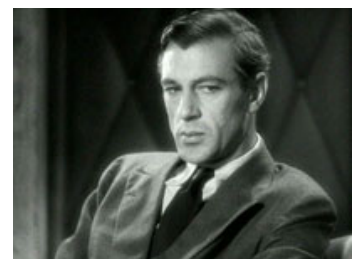
Fig. 11: Gary Cooper som Longfellow Deeds.