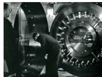
Fig. 15: Fra "American Madness" (1932): Porten til bankens allerhelligste.