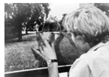
Det forgæves søgende menneske.