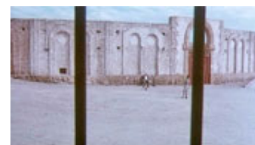
Kameraturens begyndelse ud gennem tremmerne.