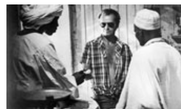
Kun i 70'erne kunne en mand gå med åbenstående skjorte og stadig være cool.