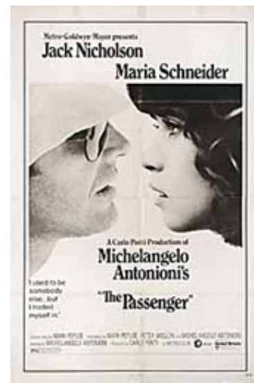
Profession Reporter / The Passenger (1975).

På baggrund af de ovenfor beskrevne plotintriger skulle man tro, at Profession Reporter er en politisk labyrintisk thriller af klassisk tilsnit, komplet med en boks fuld af hemmelige dokumenter, mystiske mænd som hele tiden dukker op og en smuk ung kvinde, som slår sig sammen med vores hovedperson. Men det er den ikke. Det er bemærkelsesværdigt, hvordan selv en professionel reporter som Locke gang på gang må indse umuligheden i at kunne gennemskue implikationerne og udrede trådene. Han er aldrig på højde med begivenhederne, altid udenforstående og fremmed i byer hvor der tales tysk, spansk og italiensk som han selv forstår meget lidt af. Thrillerplottet drives kun fremad de steder hvor det er Locke som opsøges af bagmændene – og de informationer han får kommer altid bag på ham. Når han selv opsøger lokaliteter i de mange byer resulterer det i, at det nu pludselig er ham som jages (enten af regeringen eller af sin kone) eller i lange meningsløse ventetider hvor absolut intet sker.