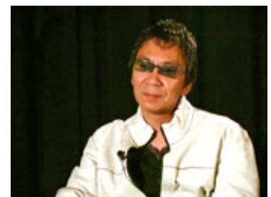
En afslappet Takashi Miike interviewes til dvd-udgaven af Audition .

Audition fortæller historien om den yderst sympatiske enkemand Aoyama, der nogle år efter sin kones død opfordres til at finde sig en