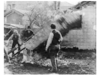
Framegrab fra Demolition d'un mur (Lumière, 1896, Ødelæggelsen af en mur ). Filmen blev optaget på Lumière-fabrikens grund, og det er Auguste Lumière, der dirigerer arbejdet.

Framegrab fra Georges Méliès' mest berømte trickfilm, La voyage dans la lune (1902, Rejsen til månen ).