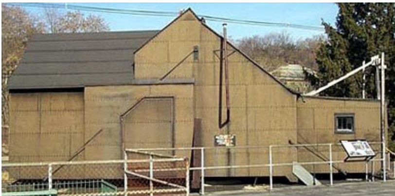
Det var Edison og Dickson, der byggede det første filmstudie overhovedet, Black Maria (afbildet herover). Det stod klar til brug i West Orange i New Jersey i februar 1893. Egentlige filmoptagelser blev dog først påbegyndt året efter. I løbet af 1894 blev der optaget over 75 film her. Disse inkluderer bl.a. Fred Ott's Sneeze , Barber Shop og Sandow, the modern Hercules . Størsteparten af filmene var beregnet til et maskulint publikum (jf. fx de mange film med let påklædte damer).

Framegrab fra Georges Méliès' mest berømte trickfilm, La voyage dans la lune (1902, Rejsen til månen ).