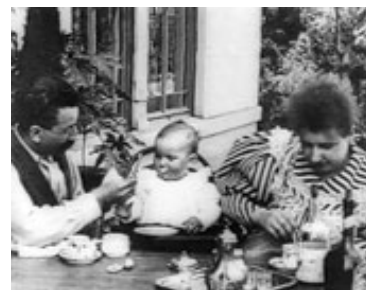
Framegrab fra Repas de bébé (Lumière, 1895).