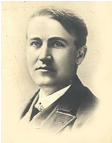
Thomas Alva Edison (1847-1931), der af Albert Einstein blev udråbt til den største opfinder i verdenshistorien. Her er han fotograferet i 1883.

Men lad os vende tilbage til begyndelsen, filmens begyndelse. Allerede i 1891 havde den verdensberømte amerikaner Thomas Alva Edisons assistent, William Kennedy-Laurie Dickson (1860-1935), opfundet Kinetografen , et uhandy og over 100 kilo tungt 35 mm. kamera. Edison troede fejlagtigt kun på den individuelle filmoplevelse, hvorfor hans fremviser, et kukkaseapparat, der blev kaldt Kinetoskopen , kun formåede at vise film for én person ad gangen. Allerede i april 1894 åbnedes i New York den første Kinetoskopbutik, hvor man enkeltvis kunne se film af knap et minuts længde.