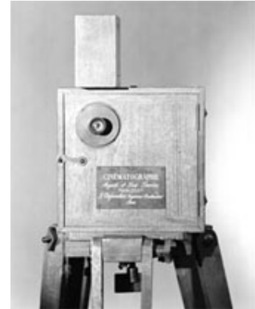
Kinematografen , Lumières kamera og projektor.

Deres smil er livløse, selvom deres bevægelser er fulde af livsenergi og er så hurtige, at de næsten bliver umulige at opfatte. Deres latter er lydløs, selvom du ser hvordan musklerne trækker sig sammen i deres grå