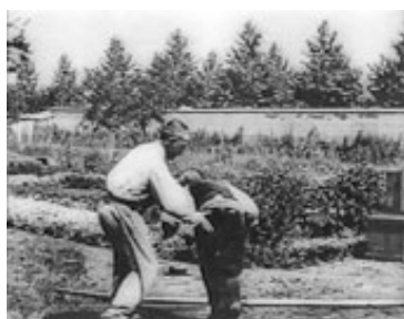
Herover: Framegrabs fra Le Jardinier et le petit espiègle (Lumière, 1895). Afstraffelsesslutninger af denne type var legio i det første tiår af filmhistorien.

I årene frem til omkring 1900 havde Lumière-brødrene stor indflydelse på verdens filmproduktion; deres film blev vist i de fleste større lande og deres måde at lave film på kom til at sætte standarden for, hvordan en film overhovedet skulle tage sig ud. Indtil 1899 bestod næsten alle film af én indstilling, og som oftest var der enten tale om en actualité eller en simpel joke à la de ovennævnte eksempler ( actualité -formatet spændte dog foruden optagelser af hverdagsbegivenheder også over nyhedsfilm og eksotiske rejsefilm). En markant undtagelse var Georges Méliès' fantastiske film, også kaldet trickfilm , som L'Escamotage d'une Dame chez Robert-Houdin (1896, En kvindes forsvinden i Robert-Houdin-teatret ), hvori Méliès skabte magiske effekter ved at stoppe optagelsen og omarrangere figurer og kulisser. Netop modstillingen mellem Lumières og Méliès' film gav senere anledning til en noget forcéret opdeling af filmhistorien i henholdsvis en realistisk og formalistisk tradition, fx hos Siegfried Kracauer i hans Theory of Film (1960), hvori filmhistorien behandles som en dialektisk spænding mellem disse to tendenser.