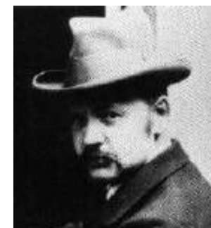
James Williamson (1855-1933).

Det berømte slutbillede i The Great Train Robbery (Porter, 1903), der også kunne anbringes i filmens begyndelse. Princippet om, at fiktionsfigurerne ikke måtte kigge ind i kameraet, den klassiske counter-look-prohibition , blev etableret i 1910'ernes Hollywood, fordi man opfattede kamerahenvendelsen som noget, der ødelagde filmens realistiske illusion.