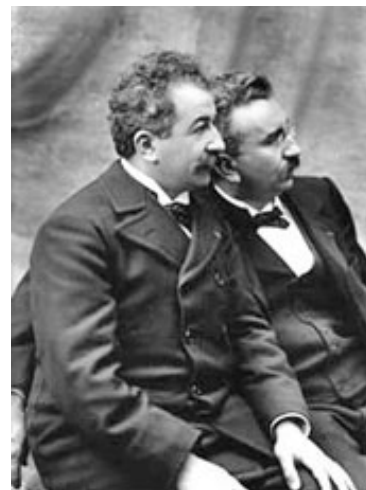
Auguste (1862-1954) og Louis (1864-1948) Lumière. Det er Louis til højre.

Det var imidlertid ikke alle de ti Lumière-debutfilm, som i egentlig forstand var dokumentariske. Den sjette film i forevisningsrækken hin aften, Le Jardinier et le petit espiègle ( Gartneren og den lille frække ), var en narrativ fiktionsfilm, for så vidt som den var iscenesat som