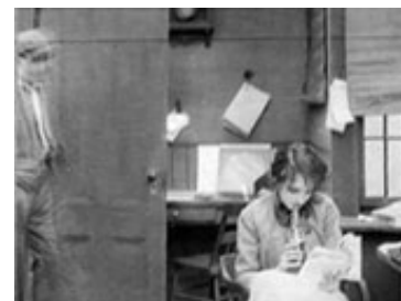
Framegrabs fra The Girl and her Trust (Griffith, 1912). Her udfoldes match-on-action -teknikken.