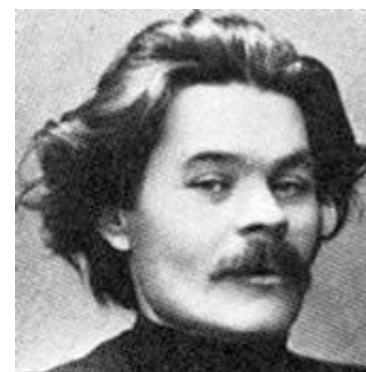
Maksím Górkij (1868-1936).