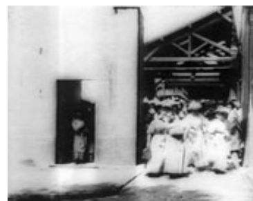
Framegrab fra La Sortie des ouvriers de l'usine Lumière à Lyon (Lumière, 1895).