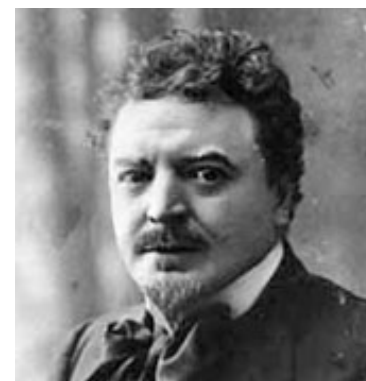
Sophus Claussen (1865-1931).