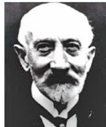
Georges Méliès (1861-1938), fransk tryllekunstner, der efter at have set Lumières kinematograf i 1895 besluttede han sig for at blive filmmager. Lumière-brødrene ville ikke sælge ham deres apparat, men i 1896 lykkedes det ham, med hjælp fra den engelske opfinder R.W. Paul, at bygge sit eget filmkamera.

Inden jeg går videre, vil jeg kort – bl.a. for at afmontere myten om Lumière-brødrene som entydige "realister" (der i Kracauers forstand henfører til instruktører, der ikke manipulerer med det "fotografiske" materiale) – henlede opmærksomheden på en lille filmperle: Demolition d'un mur (Lumière, 1896, Ødelæggelsen af en mur ). Filmen varer 50 sekunder og viser nedbrydningen af en mur. Attraktionen ved denne film ligger dog ikke så meget i selve nedbrydningen af muren, der i den sidste del af filmen på smukkeste vis bringer Gustave Courbets maleri Les casseurs de pierres (1849, Skærvæknuserne ) i erindring. Den ligger derimod i, at de omrejsende Lumière-kameramænd, efter at have projekteret filmen for publikum, stoppede kinematografen og derpå lod den fremvise nedbrydningen af muren bagfra , hvorved et spil mellem det irreelle (den "umulige" baglæns bevægelse) og det reelle (de "virkelige" kulisser) blev sat i gang. Hvis man regner