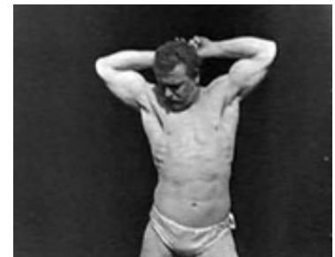
En af de mest berømte Edison-film er Sandow, the modern Hercules (Dickson, 1894). Den primære hensigt med filmen er at stille Eugen Sandows muskelmasse til skue.