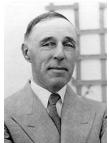
David Wark Griffith (1875-1948), en prominent figur i pre-klassisk og tidlig klassisk film. Griffith startede sin instruktør-karriere i 1908 hos filmselskabet American Mutoscope and Biograph Company , der blev grundlagt af bl.a. W.K.-L. Dickson, opfinderen af Kinetografen , i 1895.

Redigeringen i den klassiske film rettes altid ind efter den såkaldte 'handlingsakse' eller 'centerlinje'. Centerlinjen er den imaginære linje, der etableres af den dominerende retning i billedet, fx linjen, som går fra en person til en anden i en samtale (dvs. taleretningen) eller fra en person til det objekt, personen ser på (blikretningen). Pointen er nu, at centerlinjeprincippet kræver, at alle kamera-indstillinger i en scene skal være placeret på den samme side af centerlinjen, dvs. inden for en halvcirkel på 180-grader. Af samme grund kaldes centerlinjeprincippet