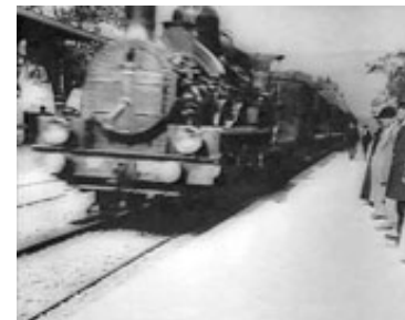
Filmen, Górkij refererer til i teksten til venstre, er Arrivee d'un Train (Lumière, 1895, Ankomst af et tog ). Filmhistorikere har yndet – og ynder fejlagtigt stadig – at citere denne film som en af de ti film, der blev vist ved Lumières første offentlige kinematograf-forevisning på Grand Café i Paris (se fx Cook: 11).

Denne oprindelige fascination af selve bevægelsen i billederne har vi uden tvivl tabt (ethvert medium mister jo med tiden sin oprindelige