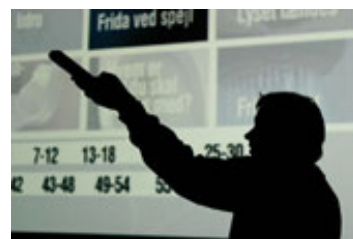
Instruktøren med fingeren på fjernbetjeningen under offentlig screening.

Måden interaktiviteten er bygget ind i filmen på betyder samtidig, at tilskuerens valg sker i blinde. Man tager ikke stilling til noget; man foretager bare en påvirkning. Dermed bevæger filmen sig klart nok væk fra fortællingen , forstået som et forløb i tid, hvor der eksisterer en eller anden form for sammenhæng og logik. En fortælling må vise hen til nogle hændelser eller oplevelser, der formidles via et medie som filmen, den mundtlige overlevering eller lignende. Samtidig kan man sige, at filmen dermed 'beviser' sin egen præmis eller ide. Pointen med filmen er, at eksistensen er meningsløs ved at bestå af tilfældigheder, ligesom filmens scener blot følger efter hinanden uden at have en 'indre sammenhæng'. Livet har ingen retning, og der gives ingen mening bag eller over det, vi foretager os.