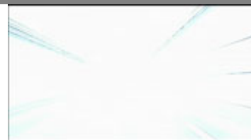
Tre frames fra filmens åbning.

Tilskueren må tværtimod mentalt gå ud af filmen og etablere en distance til det forførende for at overveje, hvordan tingene kan hænge sammen. Tilskueren bliver dermed også mere bevidst om sin egen rolle som tilskuer og vil betragte filmen som et objekt, han eller hun må forholde sig til. Tilskueren betragter den komplicerede fortælling som en gåde, der har en løsning. At forstå filmens fortælling er at løse gåden. I Switching er det dog ikke kun fortællingens struktur, der umiddelbart forhindrer tilskueren i at gennemskue plottet (sammenhængen) – det skyldes også helt basalt, at der netop ikke er noget fastlagt plot. Plottet opstår af konsekvenserne af de valg, der er blevet foretaget af tilskueren selv, og dermed af den springende fortælling, hvor man må forsøge at skabe en betydning af de forskellige sceners følgen på hinanden. Vanskeligheden i udfordringen består i, at