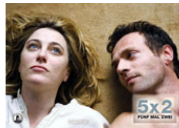
Tre frames fra filmens første kapitler - og forholdets sidste.

Vi bevæger os altså i et på alle måder visuelt gennemtænkt univers. Om man finder det fortænkt må være en smagssag.