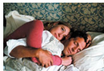
Valeria Bruni-Tedeschi som Marion og Stéphane Freiss som Gilles.