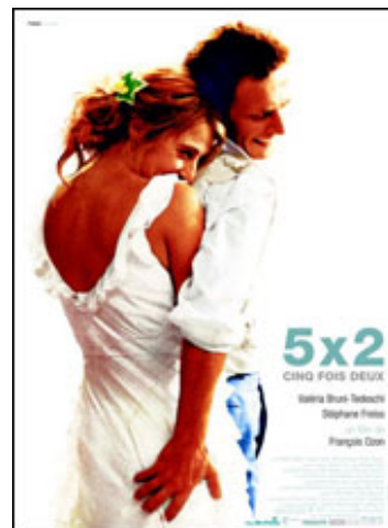
Det er med forventninger om en love story, at tilskueren lokkes til.

De stereotype kønsbilleder bliver også for meget, da Gilles ikke kan tackle at blive far og derfor værges sig ved at møde op og støtte Marion gennem den rædsomme fødsel af deres fælles barn. Det hjælper ikke meget, at vi allerede har set ham tage sig godt og kærligt af sønnen i en tidligere scene. Forestillingerne om, hvad hhv. kvinder og mænd repræsenterer og indeholder, bliver en kende for firkantede og banale.