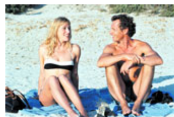
Parret, da forelskelsen er en realitet – og øjnene mødes.