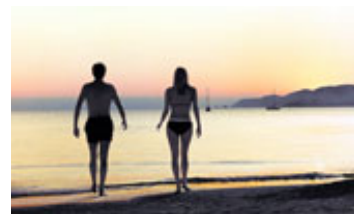
Måske peger indstillingens varighed og lys i retning af noget optimistisk: Et nyt potentiale. Men den har også en tvillingeindstilling ca. 15 min. før, og dens spor skræmmer.