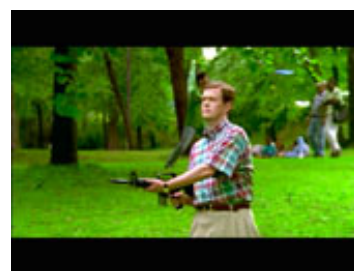
Billede 4: Titlen Happiness er en kontrastfyldt joke fra instruktøren Todd Solondz. Vi ser psykiaterens eget traumatiske mareridt eller måske ønskedrøm, hvor han skyder vildt for sig i en grøn park, mens harmonisk musik kører stille og roligt i baggrunden.