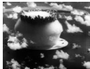
Billede 3: Mod slutningen af Stanley Kubricks Dr. Strangelove ses en billedmontage af atomprøvesprængninger, mens Vera Lynn på lydsiden frejdigt og patriotisk synger "We'll Meet Again".

Lykken er bogstaveligt talt en varm pistol i Todd Solondz' satiriske portræt af den amerikanske forstadsidyl i filmen Happiness (1998). Her går familiefaderen (Dylan Baker), der er psykiater, selv til en kollega for at fortælle som sin mystiske og traumatiske drøm, der giver ham stor tilfredshed. I drømmen går han rundt i en fredelig park så idyllisk og imødekommende, at man næsten kan høre What a Wonderful World på soundtracket. Musikken er et nydeligt klaverstykke med strygere, mens billedsiden viser familiefaderen, der går stille og roligt rundt med en maskinpistol i favnen. Han skyder tilfældigt omkring sig med et dødt blik i øjnene (Billede 4), mens folk kaster sig rundt i parken med dødbringende skudhuller i kroppen. Musikken fortsætter og bliver en synlig kontrast til de voldelige billeder. Det perverse ved hans person bliver forstærket, drømmen bliver med andre ord endnu mere syg og foruroligende ved at sammenstille smuk underlægningsmusik med pistolskud.