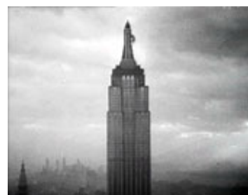
Billede 2: I King Kong bruges Mickey Mouse -effekten, når kæmpeaben klatrer op af Empire State Building. Abens bevægelser og Max Steiners musik følger fuldstændigt hinanden som en synkron, sammentømret enhed.