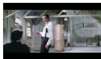
Billede 9: I Reservoir Dogs laver Quentin Tarantino en klar reference til A Clockwork Orange i en brutal torturscene, hvor en smuk ballade gør billederne endnu mere isnende i deres udtryk.