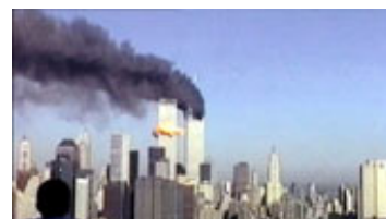
Billede 1: I Bowling for Columbine bruger Michael Moore med spydig sarkasme Louis Armstrongs What a Wonderful World som underlægningsmusik til bl.a. rystende billeder fra terrorangrebet 11. september.