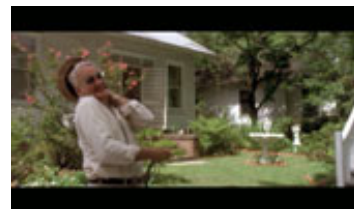
Billede 6: I David Lynch' Blue Velvet får ægtemanden et hjerteanfald, mens den nostalgiske titelsang fortsætter, som om intet var hændt.