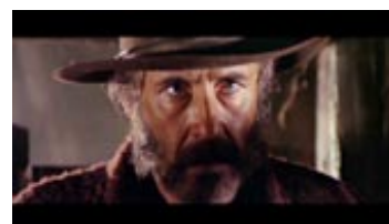
... og Cheyenne.