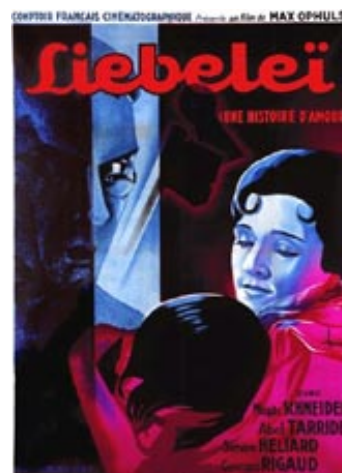
Fig.1: Næsten samtlige Ophuls' film er baseret på romaner, noveller og teaterstykker, og selv om Ophuls arbejdede med i manuskriptudviklingen var det altid med professionelle manuskriptforfattere. De endelige film kan sjældent siges at "være tro mod det litterære forlæg" og bærer ej heller præg af romanoprindelse såsom fx Truffauts egen Jules og Jim (1962). En revurdering af manuskriptforfatterne Jean Aurenche og Pierre Bost samt hele den kvalitetstradition, som Truffaut forfægter, kunne have et passende pejlepunkt i værker instrueret af Max Ophuls.